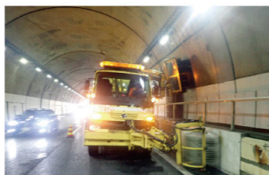
トンネル壁面清掃