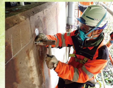
橋梁検査路補修 (6~11月) 橋の点検で使用する専用通路の補修を行います。