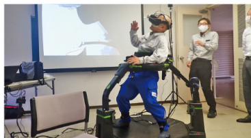
安全教育システム、 セーフティトレーニング、VR研修