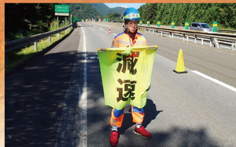
交通規制・監視 (4~11月)