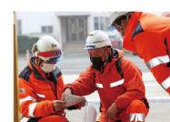
安全対策検討会での内容をもとにKY(危険予知)を実施