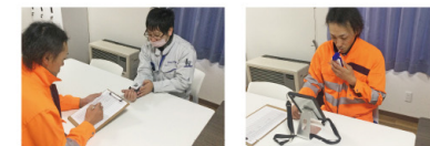
血圧・体温・アルコールチェック

日々の体調管理を徹底し、スタッフをバックアップ。新型コロナウイルス対策やインフルエンザ予防、熱中症対策にも力を入れています。