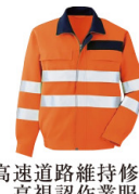
高速道路維持修繕 高視認作業服

高視認 (JIS規格 T8127 クラス3)、機能性 (セパレートタイプ)、通気性 (メッシュタイプや空調服の採用) を重視し、作業スタッフの安全性と快適性を考慮した作業服を採用。