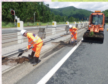
排水溝清掃 (4~11月) 砂や泥、枯葉などを取り除き、排水溝が詰まらないように保ちます。

道路には安全というシーズンはありません。 通年、または季節ごとに行うべき作業を把握して整理し 綿密なスケジュールを組んで維持修繕を行い 一年中、いつも快適な高速道路を保つこと。 それは私たちテクノスグループの、責任のカレンダー。