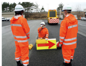
新任研修 (交通規制講習)