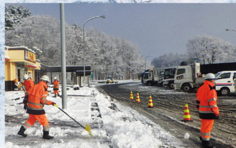
サービスエリア歩道部除雪作業 (冬期間)