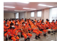
事業所月例安全大会

毎日欠かさず行う確認も、改めて見直し意識づける定期的な機会も。安全をすべての基本と考え、多彩な活動を行っています。