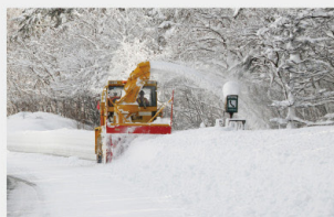
ロータリーによる排雪作業