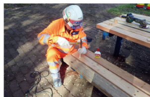
サービスエリア等の設備補修