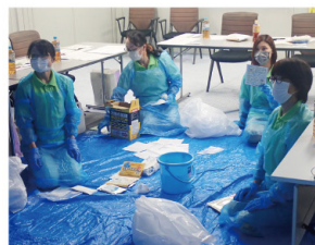
清掃スタッフ研修