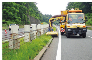
万能車による草刈り作業