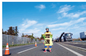
交通規制・監視(テクノスワーク)

カラーコーンや矢印板を設置し作業スペースを確保したのち一般車両等の監視を行います。