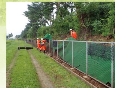
防草対策 (6~11月) 草木の繁茂を防ぐため防草シートを敷設します。