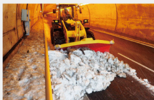
トンネル内排雪作業