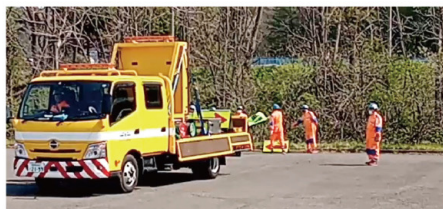
警備員教育 (テクノワーク)